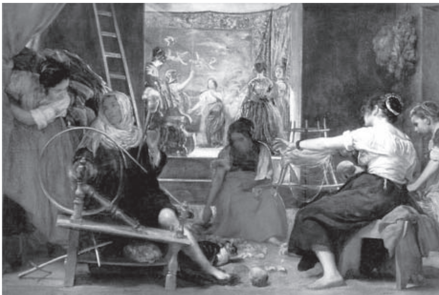
Figura 5. Velázquez. As fiadeiras. 1657. CD Rom: Os Grandes Pintores Multimídia. F e G Editores, Equador, 1997.

É claro que sempre existe o perigo de caminhar em círculos nesse método tão popular há trinta anos, devido, em última instância, à influência do grande historiador da arte Erwin Panofsky. Eu mesmo formulei esse tipo de interpretação em relação a quadros mitológicos de Botticelli (Fig. 6), que cheguei a associar com os círculos neoplatônicos de Florença. Desde então, e como muitos de meus colegas do Instituto Warburg, tornei-me cada vez mais cético a respeito dessas teorias, que não conseguiram conquistar maior grau de certeza que as atribuições dos connaisseurs (GOMBRICH, 1992, p. 131-140).