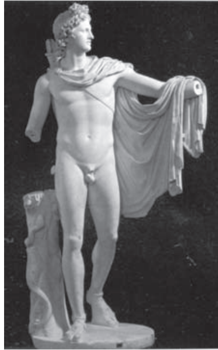
Figura 2. Apolo de Belvedere. C. 350 a.C. Cópia romana em mármore. (GOMBRICH, 1993, p. 70)