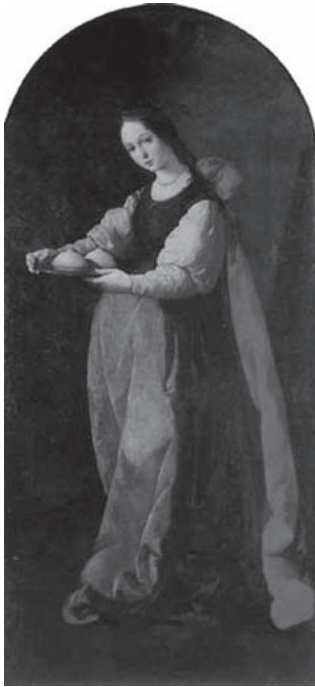
Figura 1. Zurbarán. Santa Águeda. 1631-1640. CD Rom. Grandes Pintores. Equador: F e G Editores, 1997.