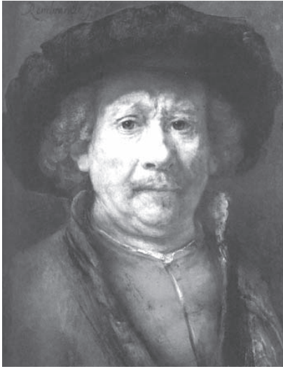
Figura 4. Rembrandt. Auto-retrato. C. 1658. (GOMBRICH, 1993, p. 331).

seur , já que não tenho nem a memória visual, nem o interesse especializado que o caracterizam. Além dessas limitações, uma das razões que me levaram a inclinar-me para outros temas de estudo foi, também, certo ceticismo inato. Estou profundamente convencido de que existem muitas perguntas na história da arte para as quais jamais obteremos respostas; por isso, dedicar-lhes tempo parece-me mais grave do que a perda de tempo. Em todo caso, desejo deixar claro que estabelecer uma atribuição a um artista particular ou datar corretamente uma obra não são as únicas respostas que se esperam dos especialistas em arte. O público também há de querer conhecer o que significa ou o que representa a estátua do Apolo de Belvedere ou o quadro de Santa Águeda.