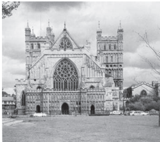
Figura 9. Catedral de Exeler, fachada oeste. C.1350-1400. (GOMBRICH, 1993, p. 155).

A maioria dos escritos sobre a arte do século XX é fortemente influenciada pela ideologia do progresso, que Karl Popper denominou “historicismo”. Trata-se de uma atitude contrária aos questionamentos. As mudanças que identificamos na arte contemporânea são aceitas como novas revelações do “espírito da humanidade”. Dessa forma, seria quase uma blasfêmia constranger o “espírito dos tempos” com perguntas impertinentes. De fato, se isso acontece, quem as faz corre o risco de ser qualificado como herege e inimigo do progresso, ou mesmo como um reacionário, que a história se incumbirá de relegar ao esquecimento.