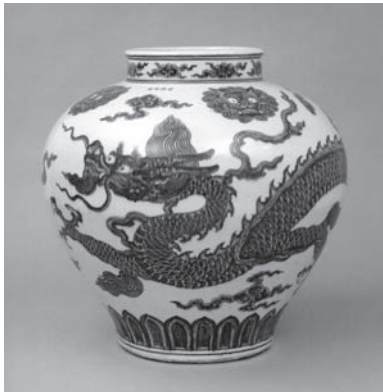
Figura 3. Dinastia Ming chinesa. Porcelana – 1426-1435. Master Pieces of Metropolitan Museum of Art. 1997. New York. The Sarabanda Press, Verona.

entar um colecionador ou o conservador de um museu sobre o que se deve escrever no título ou rótulo com o qual se identifica um determinado objeto artístico.