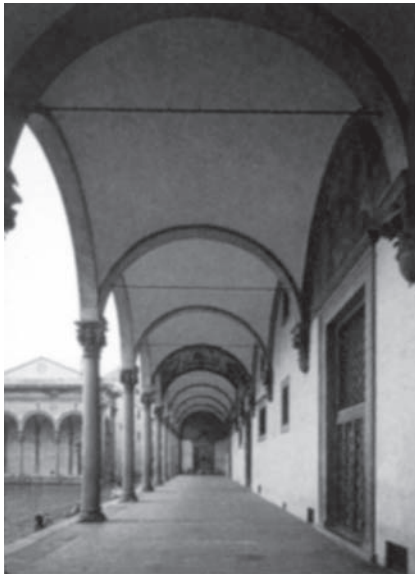
Figura 7. Hospital dos inocentes (Florença, Fillippo Bninelleschi).

Para tanto, basta observar a fotografia que reproduz o efeito da representação do poste ao fundo da imagem e, à esquerda, no primeiro plano (Fig. 7). * O poste parece-nos tão pequeno que somos obrigados a verificar as medidas para nos convenceremos de que não estamos enganados. Esta fotografia ensinou-me mais coisas do que muitas páginas de teorização sobre a percepção. 8 O que busquei com essa pequena experiência é uma resposta parcial à pergunta de por que a aplicação da geometria projetiva à arte – que denominamos perspectiva –, implicou tantas e tão grandes mudanças na história da pintura? Mais ainda, por que alguém desejou aplicar esse recurso?