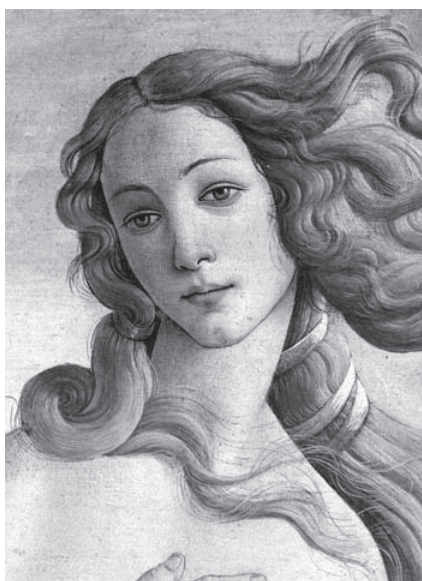
Figura 6. Botticelli. Nascimento de Vênus (detalhe). C. 1485. (GOMBRICH, 1993, p. 200)

É claro que sempre existe o perigo de caminhar em círculos nesse método tão popular há trinta anos, devido, em última instância, à influência do grande historiador da arte Erwin Panofsky. Eu mesmo formulei esse tipo de interpretação em relação a quadros mitológicos de Botticelli (Fig. 6), que cheguei a associar com os círculos neoplatônicos de Florença. Desde então, e como muitos de meus colegas do Instituto Warburg, tornei-me cada vez mais cético a respeito dessas teorias, que não conseguiram conquistar maior grau de certeza que as atribuições dos connaisseurs (GOMBRICH, 1992, p. 131-140).